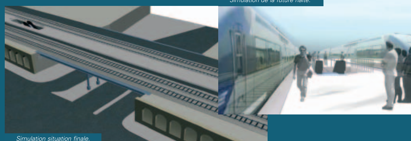
Simulation situation finale.