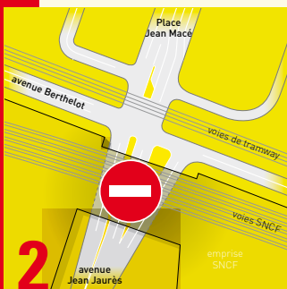
Phase 2 : circulation interdite

L'avenue Jean Jaurès sera complètement fermée à la circulation pour permettre la démolition du pont route.